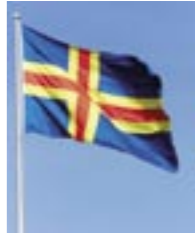
Åland posee su propia bandera desde 1954.

Después de que se completase la Ley Autonómica del año 1920 con las cláusulas de adquisición territorial y de derecho al voto, se celebraron en 1922 las primeras elecciones al Parlamento ålandés: El Lagting, denominado anteriormente Landsting, que disfrutó de su primera sesión plenaria el 9 de junio, fecha en la que actualmente se conmemora la autonomía de Åland. La Legislación Autonómica ha sido totalmente revisada en dos ocasiones: En 1951 y en 1993.