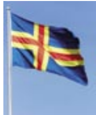
Åland posee su propia bandera desde 1954.

Después de que se completase la Ley Autonómica del año 1920 con las cláusulas de adquisición territorial y de derecho al voto, se celebraron en 1922 las primeras elecciones al Parlamento ålandés: El Lagting, denominado anteriormente Landsting, que disfrutó de su primera sesión plenaria el 9 de junio, fecha en la que actualmente se conmemora la autonomía de Åland. La Legislación Autonómica ha sido totalmente revisada en dos ocasiones: En 1951 y en 1993.