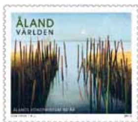
Serviciul poștal din Åland. „Längtan” de Guy Frisk.