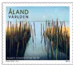
Почтовая служба Аландских островов. 'Långtan', Гай Фриск.