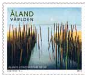
บริการไปรษณีย์ Åland 'Långtan' โดย Guy Frisk